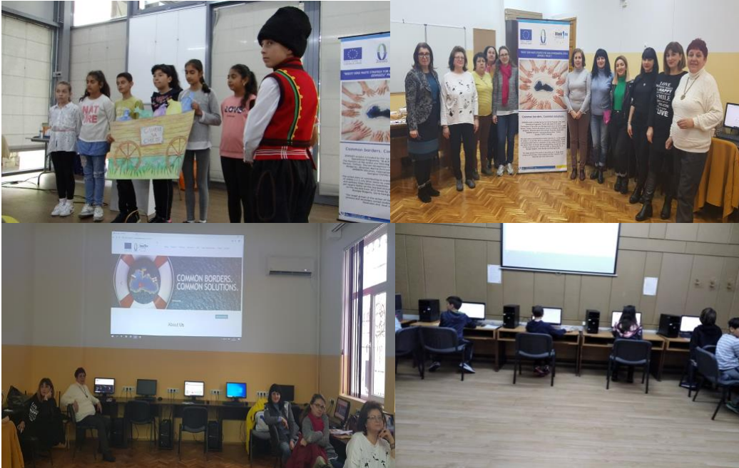
ილუსტრაცია 4. სურათები გადაღებულია სკოლებში EEP ტრენინგის დროს, ბურგასი (ბულგარეთი)

ეს პროექტი დაფინანსებულია ერთობლივი საოპერაციო პროგრამის "შავი ზღვის აუზის 2014-2020" ფარგლებში