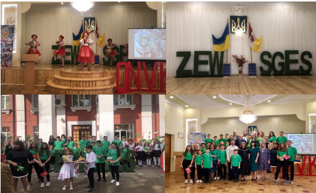
ილუსტრაცია 5. სურათები გადაღებულია სკოლებში EEP ტრენინგის დროს, ოდესა (უკრაინა)