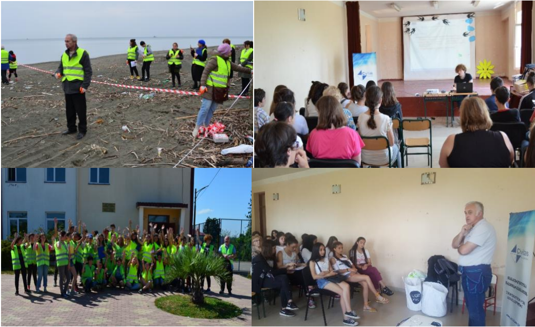
ილუსტრაცია 6 სურათები გადაღებულია სკოლებში EEP ტრენინგის დროს, გურია (საქართველო)

ეს პროექტი დაფინანსებულია ერთობლივი საოპერაციო პროგრამის "შავი ზღვის აუზის 2014-2020" ფარგლებში