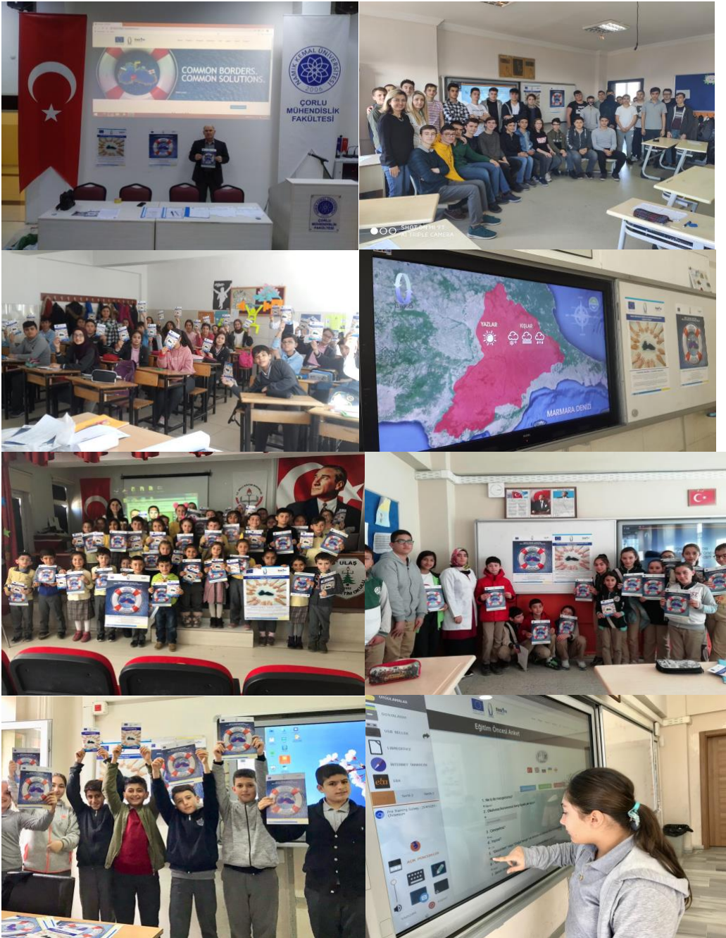
ილუსტრაცია 3. სურათები გადაღებულია სკოლებში EEP ტრენინგის დროს, ტევირდაგი (თურქეთი)

ეს პროექტი დაფინანსებულია ერთობლივი საოპერაციო პროგრამის "შავი ზღვის აუზის 2014-2020" ფარგლებში