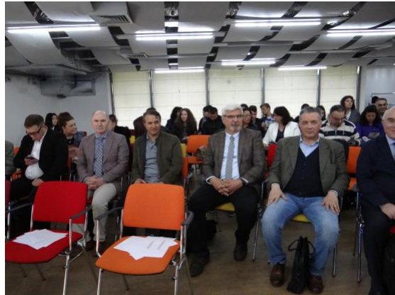
სურათი 2. პროექტის შეხვედრები ბულგარეთში 14-15 მაისი, 2019