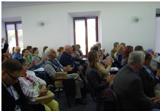
სურათი 3. პროექტის შეხვედრები უკრაინაში 19-20 სექტემბერი, 2019