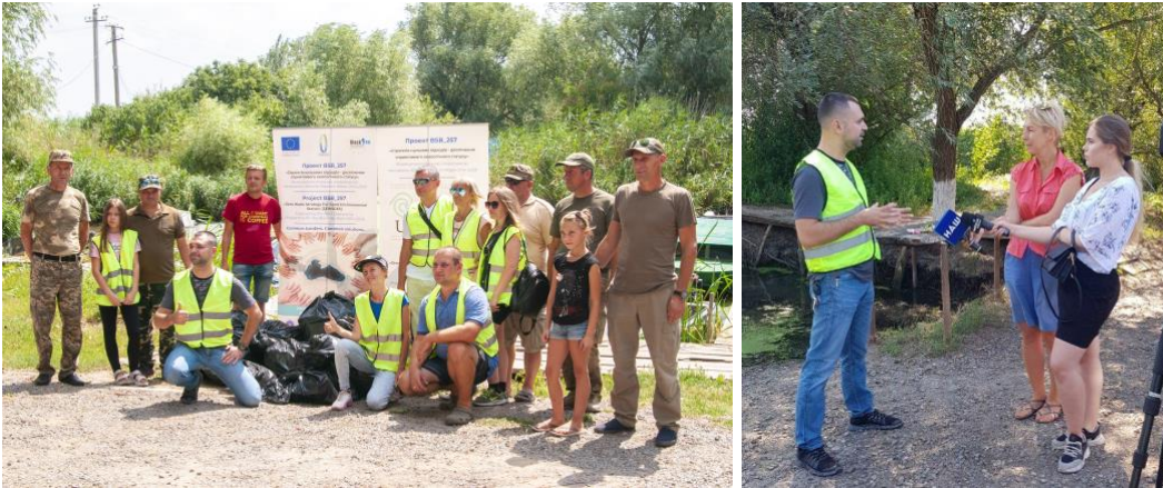
Figure 4. UKRMEPA მიერ განხორციელებული აქტივობა, აგვისტო 2020.

უკრაინა (UKRMEPA) განახორციელა ზღვიდან ნარჩენების ამოღება 2020 აგვისტოში (იხილეთ სურათი 4) და დანარჩენ სამ ქვეყანაში ეს აქტივობა დასრულდება 2020 ბოლომდე. სულ 52 ადამიანმა მიიღო მონაწილეობა აქციაში, შეგროვდა ნარჩენების 70 ტონარა საერთო წონით 700კგ.